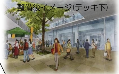
整備後イメージ(デッキ下)