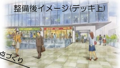
整備後イメージ(デッキ上)