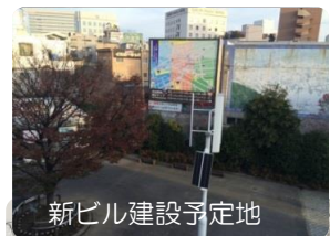
新ビル建設予定地