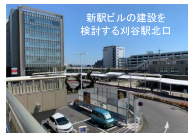
新駅ビルの建設を検討する刈谷駅北口

さはらの要望『刈谷駅北口に設置予定の地域交流施設は、健全な運営に努めるとともに、施設の清掃を障がい者が担ったり、福祉製品の販売ができるようにすべき。刈谷駅周辺の再開発(刈谷駅のホーム拡幅・ホームドア設置、駅デッキ延伸、桜町交差点歩道橋整備、駐輪場再整備、ロータリー周辺の機能強化、新駅ビル構想等)は、刈谷の未来に必要な事業だが、駅周辺に大きな変化が生じる。旧来の在住者、新たな居住者、来訪者が バランスよく共存できる環境づくり も併せて推進願いたい。』