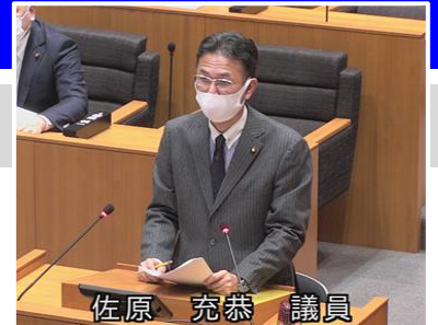
佐原 充恭 議員

『緊急事態宣言以降、テレワークの在宅勤務時の利用可否の問い合わせには、できる限りクラブ内の3密を避ける為、 利用を控えて頂く様回答してきた が、企業等のテレワークの実態はその頻度や勤務場所、急遽出社となる可能性等、 不規則・不安定 な部分があることや、 感染拡大防止の企業努力 であること等を考慮し、現在は在宅勤務も 通常勤務と同様とし、利用可能としている。 』