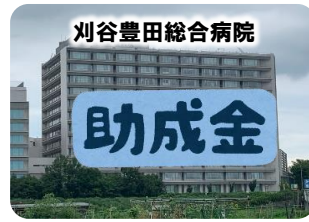
刈谷豊田総合病院