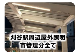
刈谷駅周辺屋外照明 市管理分全て