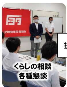
くらしの相談 各種懇談

3. 道路、河川、施設の危険箇所や不具合への対応＝関係団体や地域社会の声、自らの調査に基づき★のべ100か所以上を改善、改修、修繕。