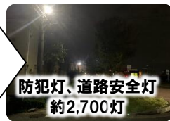
防犯灯、道路安全灯 約2,700灯