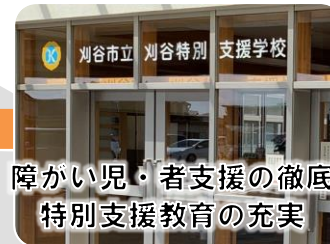
障がい児・者支援の徹底 特別支援教育の充実