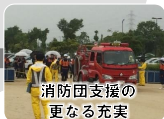
消防団支援の 更なる充実