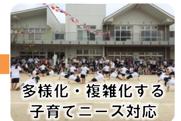
多様化・複雑化する 子育てニーズ対応