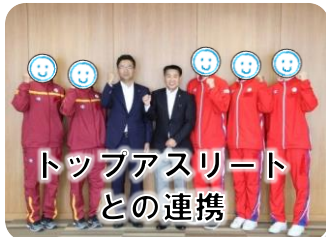
トップアスリート との連携