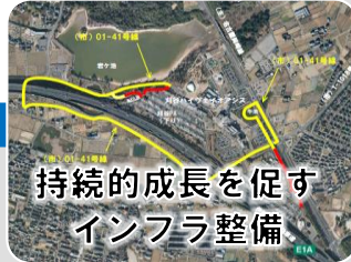
持続的成長を促す インフラ整備