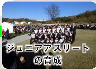
ジュニアアスリート の育成