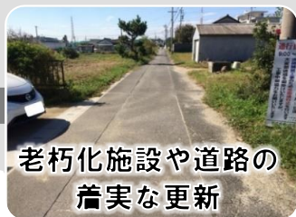
老朽化施設や道路の 着実な更新