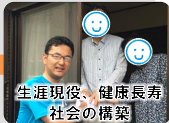
生涯現役、健康長寿 社会の構築