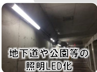
地下道や公園等の 照明LED化