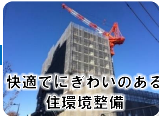
快適でにぎわいのある 住環境整備