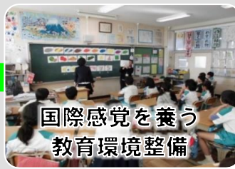
国際感覚を養う 教育環境整備