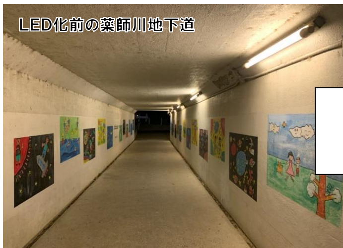
LED化前の薬師川地下道