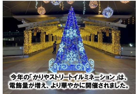
今年の「かりやストリートイルミネーション」は、電飾量が増え、より華やかに開催されました。