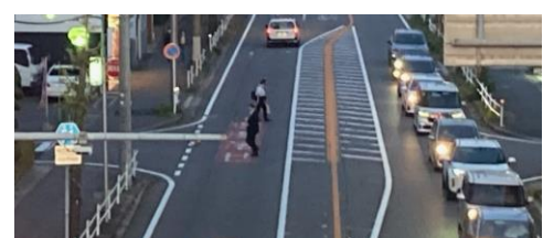
事故後も減る気配がない乱横断の様子

『刈谷は車のまちであり、 市内企業が車の予防安全装置等の開発を担い、事故の低減に寄与 している。 行政も両輪となって取り組まねばならない 。「どうすれば乱横断を回避して頂けるか」知恵を絞り、 更なる啓発、物理的・法的抑止、ICT活用(例:名鉄の踏切内異常検知システム) などの対策を、 主体的かつ具体的に講じて頂きたい。 』