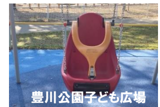
豊川公園子ども広場