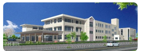
特別支援学校イメージ図

さはらの質問★現在、ひいらぎ特別支援学校までは、市内から通学バスが運行されているが、このバスは継承されるか？