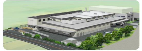
新第一給食センターイメージ図

さはらの要望：調理室自体をわけて調理するとの事で、事故防止に万全を期している事がわかったが、 ヒューマンエラー（人為的ミス）が発生しないよう、調理訓練の徹底をお願いする。 また、完成時は施設の内覧会を開催頂きたい。