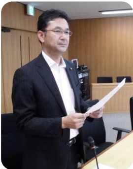
質問イメージ(再現)

さはらの提案☆刈谷市は1日約16,000食の給食を調理している。熊本や大分県産の食材を使った「仮称:熊本・大分応援給食」を提供し、被災地支援を行ってはどうか?